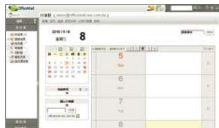
OfficeMail 企業郵件行事曆介面