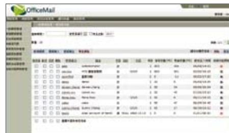
OfficeMail 企業郵件管理者介面