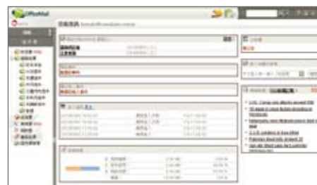
OfficeMail 企業郵件使用者介面

OfficeMail 提供專業客服人員，為您解答任何郵件問題，不會讓您的 E-mail 成為孤兒信箱。